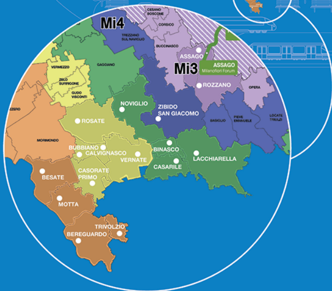
Mappa del sistema tariffario integrato del bacino di mobilità (Istibm) Milano - Monza Brianza